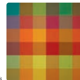
Art nr: 1513-578